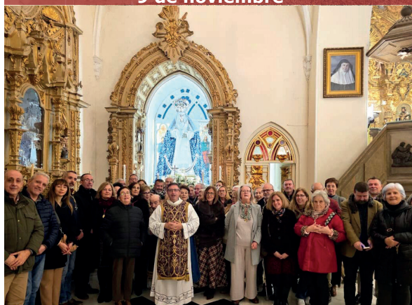
23. Bendición del nuevo Camarín en Santa Ana para María Stma de los Dolores. 18 de diciembre