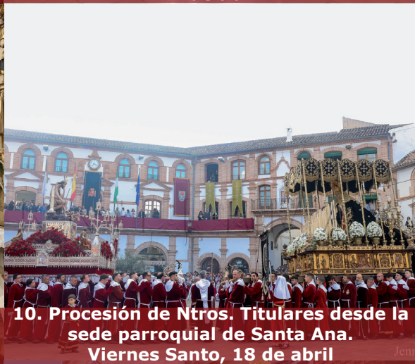
10. Procesión de Ntros. Titulares desde la sede parroquial de Santa Ana. Viernes Santo, 18 de abril