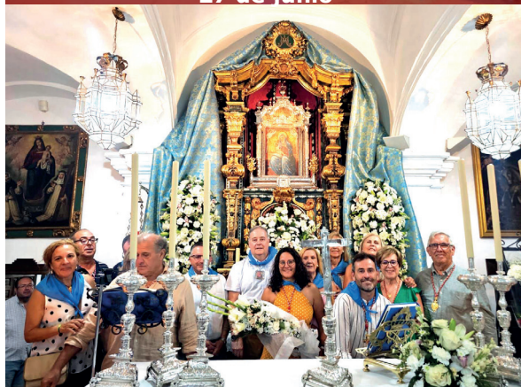
15. Ofrenda floral a la Virgen de Gracia con motivo de la Fiesta y Feria. Caseta Humildad. 14 al 18 agosto