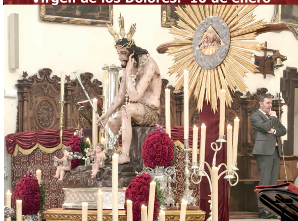
3. Triduo y Función Solemne a Ntro. Padre Jesús de la Humildad. Del 13 al 16 de marzo