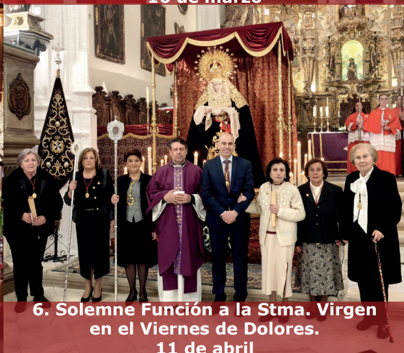
6. Solemne Función a la Stma. Virgen en el Viernes de Dolores. 11 de abril