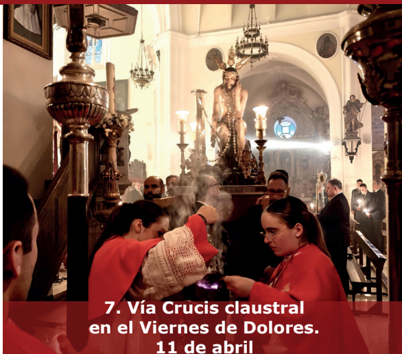
7. Vía Crucis claustral en el Viernes de Dolores. 11 de abril