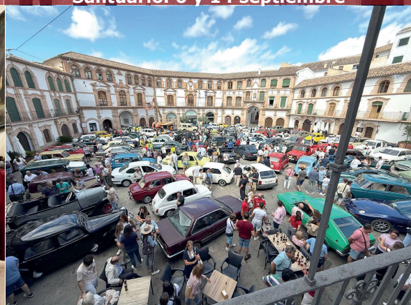
18. VI Concentración de coches clásicos. 28 de septiembre