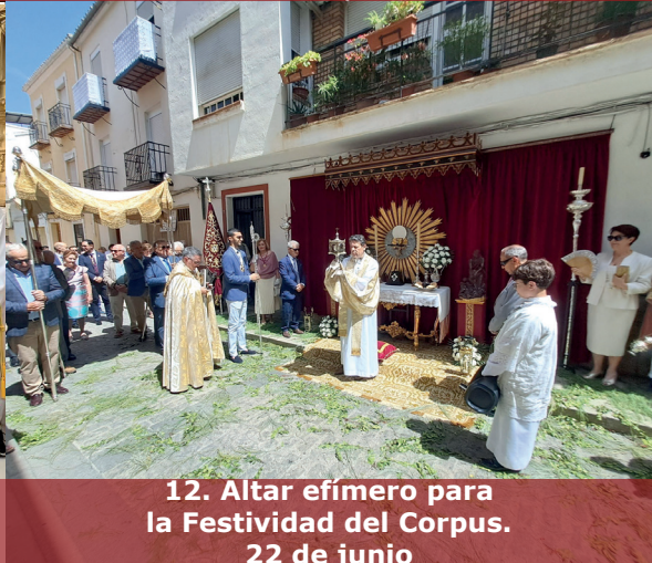
12. Altar efímero para la Festividad del Corpus. 22 de junio