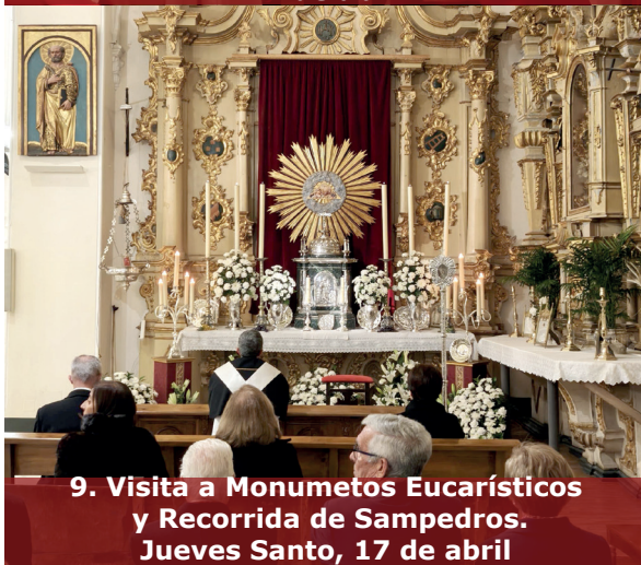
9. Visita a Monumetos Eucarísticos y Recorrida de Sampedros. Jueves Santo, 17 de abril