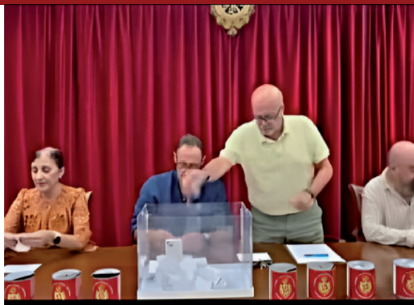
19. Sorteo de la VI edición de Huchas Solidarias. 26 de septiembre