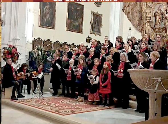
24. Participación en el Certamen de Villancicos de la Agrupación. 19 de diciembre