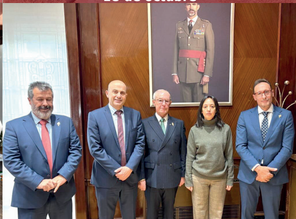
22. Visita a la Directora Gral. GC en Madrid y al Colegio GJ Valdemoro. 28 de noviembre