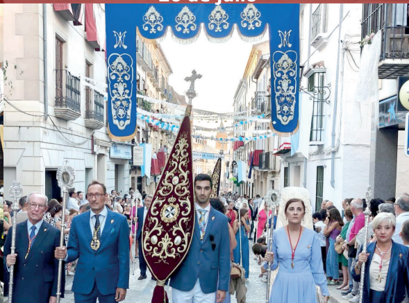
16. La Cofradía acompaña a la Patrona en sus procesiones de bajada y subida al Santuario. 6 y 14 septiembre