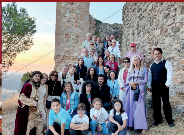
20. Jornada cultural: visita "Arxiduna dormida". 18 de octubre