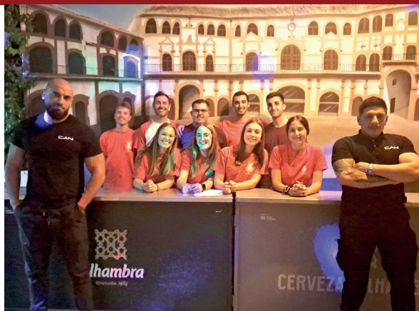
13. IV Fiesta del Verano organizada por nuestra juventud cofrade. 27 de junio