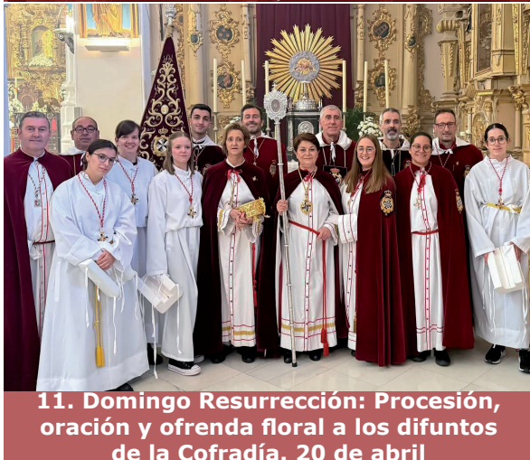
11. Domingo Resurrección: Procesión, oración y ofrenda floral a los difuntos de la Cofradía. 20 de abril