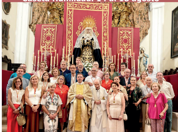
17. Celebración eucarística en la Festividad de la Virgen de los Dolores. 15 de septiembre