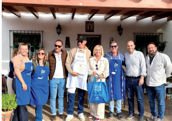
21. Tradicional convivencia de las Migas cofrades en la Vega. 9 de noviembre