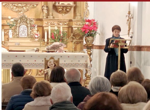
1. 80 Aniv o de las Hnas de la Cruz como Camareras Honorarias de la Virgen de los Dolores. 10 de enero