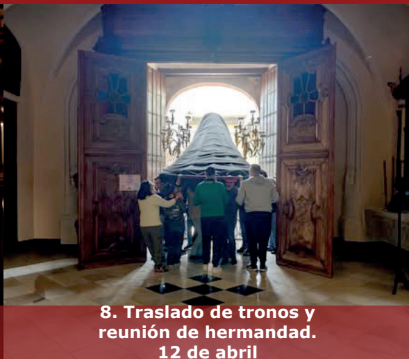
8. Traslado de tronos y reunión de hermandad. 12 de abril